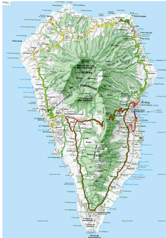
La Palma < http://mappery.com/map-of/La-Palma-Physical-Map >. Luettu 29.3.2011.