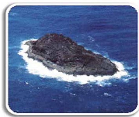
Roque del Oeste < http://www.reptilesdecanariastjorge.com >. Luettu 31.3.2011.