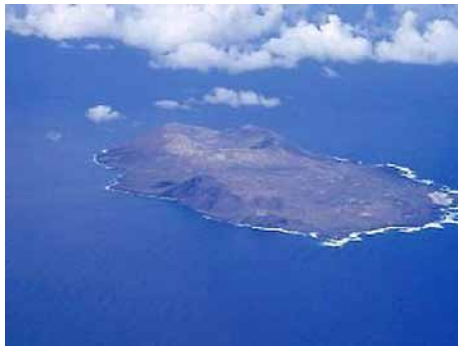
Alegranza < http://www.lanzarote.org/blog/?p=629 >. Luettu 31.3.2011.